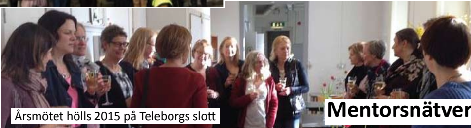
Årsmötet hölls 2015 på Teleborgs slott