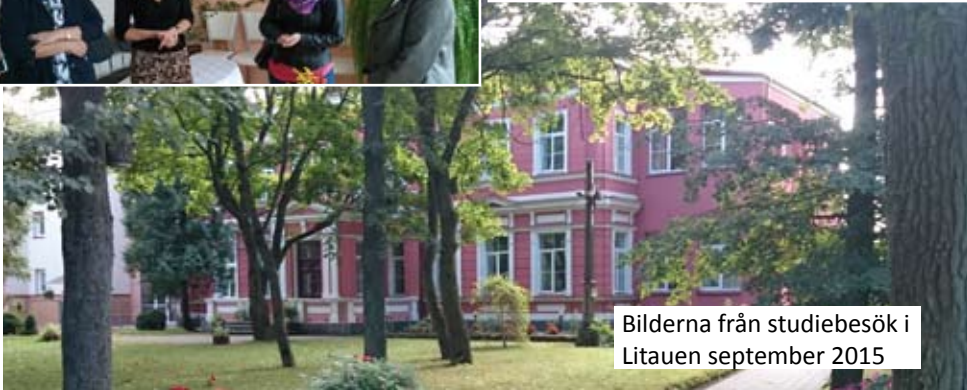
Bilderna från studiebesök i Litauen september 2015